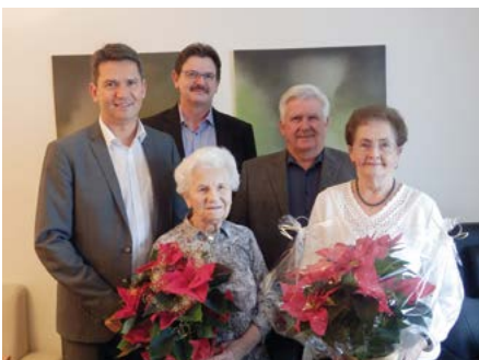
90. Geburtstag von