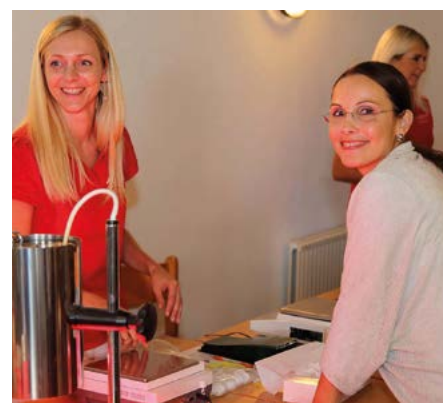
Auch die Apotheke informierte beim Gesundheitstag im Kulturzentrum