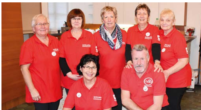
Die freiwilligen Helferinnen und Helfer des Club Miteinander Siegendorf.