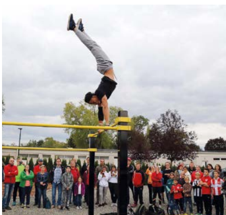
Eröffnung des Fitness-Parks gegenüber des Freibads.

Mit einer starken Show von Fitness-Profis wurde der hundert Quadratmeter große Fitnesspark beim Freibad eröffnet. Zahlreiche Siegendorfer waren bei der Eröffnung zugegen, um sich den einen oder anderen Tipp von den Experten zu holen. Selbst Experten sind die jungen Siegendorfer bereits in der Halfpipe gegenüber des Fitnessparks. Das beweisen die Kids am Skaterpark regelmäßig mit gekonnt durchgeführten waghalsigen Manövern.