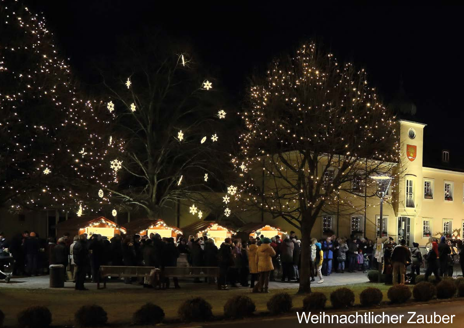
Weihnachtlicher Zauber am Siegendorfer Rathausplatz