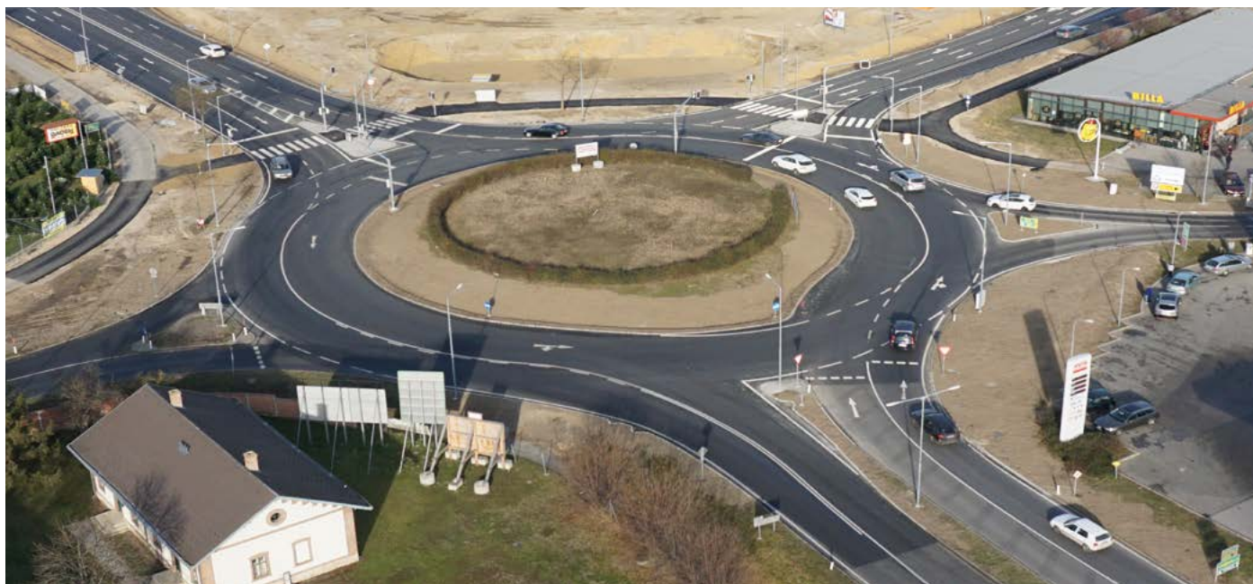
Die Kreisverkehr-Bauarbeiten sind seit Anfang Dezember abgeschlossen.