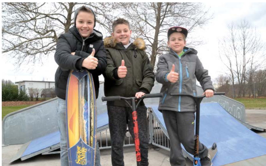
Daumen hoch: der Skaterplatz hinter dem Freibad ist geöffnet