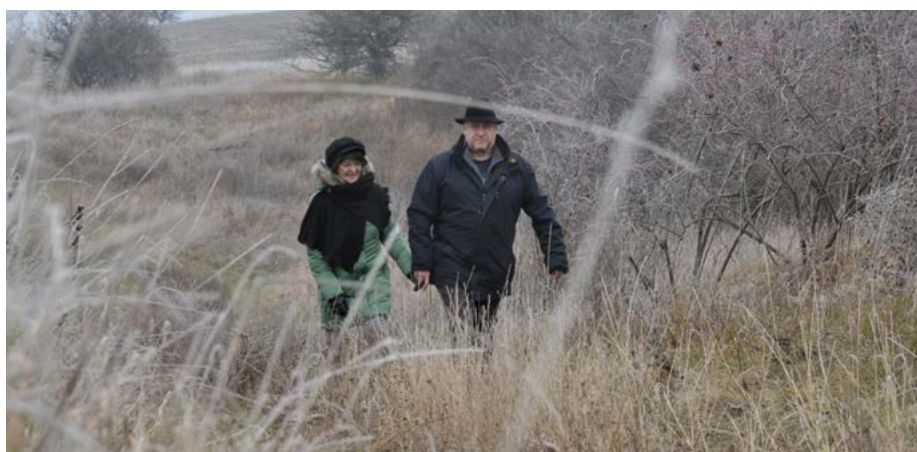
Naturgenuss: Wanderung im Siegendorfer Naturschutzgebiet

Dadurch finden die Kids, sollte im heurigen Winter Schnee fallen, perfekte Bedingungen zum Rodeln vor und der Skradnji Brig wird zu einem beliebten Treffpunkt für Kinder und ihre Eltern.