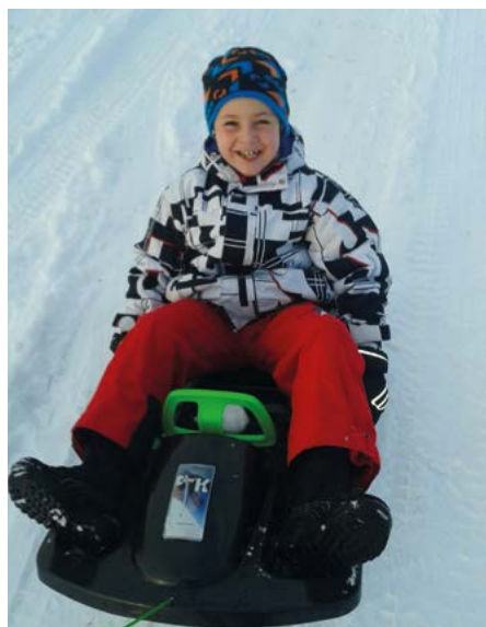
Rodeln am Skradnji Brig

Noch lässt Frau Holle auf sich warten – doch die Gemeinde ist bereits gerüstet, um dem Nachwuchs bestes Vergnügen im Schnee zu bieten. Am Skradnji Brig wurde die Wiese am Berg von der Gemeinde abgemäht.