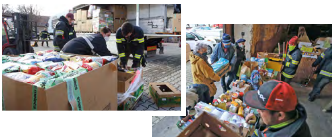
Vor dem Transport: Beladung der Fahrzeuge (links) und Entgegennahme und Sortierung der vielen Spenden (rechts)