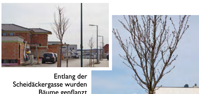
Entlang der Scheidäckergasse wurden Bäume gepflanzt