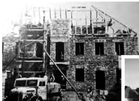
Das Siegendorfer Rathaus am heutigen Standort wurde 1955 mit einem großen Fest eingeweiht

Am 28. Juni 1955 fand dann die Rathausweihe – gemeinsam mit der Rennerdenkmalweihe – statt. Bis zu dieser Eröffnung, die ein großer „Feiertag“ für die Siegendorfer Bevölkerung war, befand sich das Gemeindeamt – und die Wohnung des Amtmannes Franz Kugler, der jahrzehntelang für die Verwaltung der Gemeinde Siegendorf verantwortlich war – im vormaligen Kindergarten auf der Hauptstraße. Es gab aber auch vorher einen anderen Standort für das Gemeindeamt. Fast bis zur Jahrhundertwende befand sich das