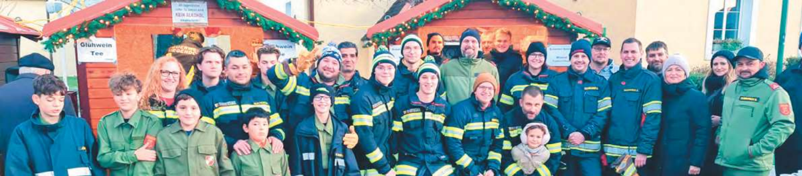
Start in den Advent im Dorf – traditionell mit der Feuerwehr Siegendorf