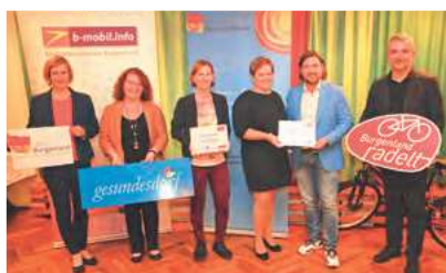
„Burgenland radelt“: zweiter Platz für die Gemeinde Siegendorf