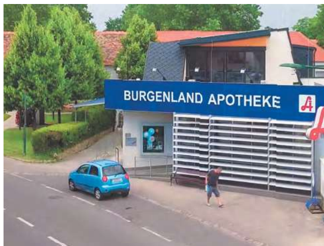
Siegendorf ist in punkto Medikamentenversorgung schon seit über 100 Jahren gut aufgestellt