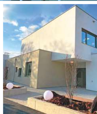
Kurz vor der Fertigstellung: der neue Kindergarten direkt neben der Volks- und Mittelschule