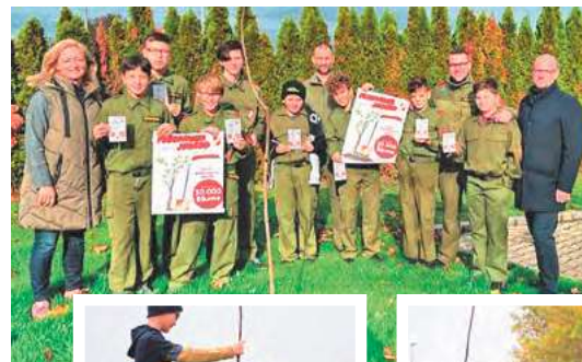
Starke Aktion des Siegendorfer Feuerwehrynachwuchses, unterstützt von der Gemeinde Siegendorf

I m ganzen Burgenland hatten die Mitglieder der Feuerwehrjugend die Möglichkeit, Bäume zu setzen. An dieser Aktion beteiligte sich auch der Siegendorfer Feuerwehrynachwuchs. Als Standort für die jungen Bäume wurde der Bereich zwischen Freibad und Tennisplatz ausgewählt, wo in den letzten Jahren einige Trauerweiden Bränden zum Opfer fielen.