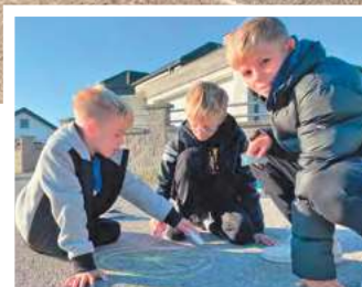
Volksschüler malen für Klimaschutz und mehr Verkehrssicherheit