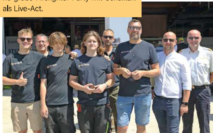
Ehre, dem Ehre gebührt: Auszeichnungen und Beförderungen