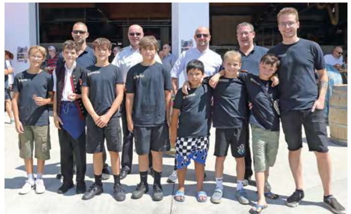
Auch die Jugendlichen bekamen für ihren Wettkampf Abzeichen verliehen