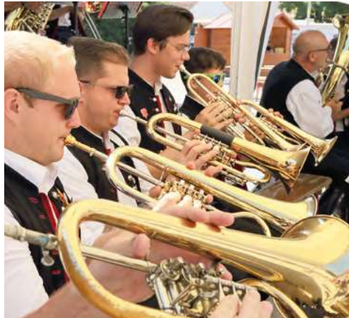
Start in den Sonntag: zünftiger Frühschoppen mit dem MVS

SAVE THE DATE: Am 23. und 24. September veranstaltet die FF Siegendorf die Firefighter Combat Challenge. Die härtesten Feuerwehrmänner aus rund einem Dutzend Nationen werden sich vor dem Feuerwehrhaus in einem atemberaubenden Wettkampf messen. Auf die Gäste wartet am Samstag am Abend eine große Firefighter-Party mit Schalltaxi als Live-Act.