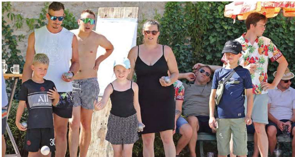
Sandige Action und heiße Spiele den ganzen Samstag über am Boccia-Platz