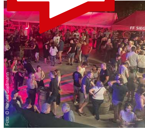
Tolle Stimmung, feines Ambiente, gute Musik – ein gelungenes Fest