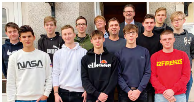
Gemeindevertreter mit den Rekruten vor dem Gasthaus Sonnenstrahl