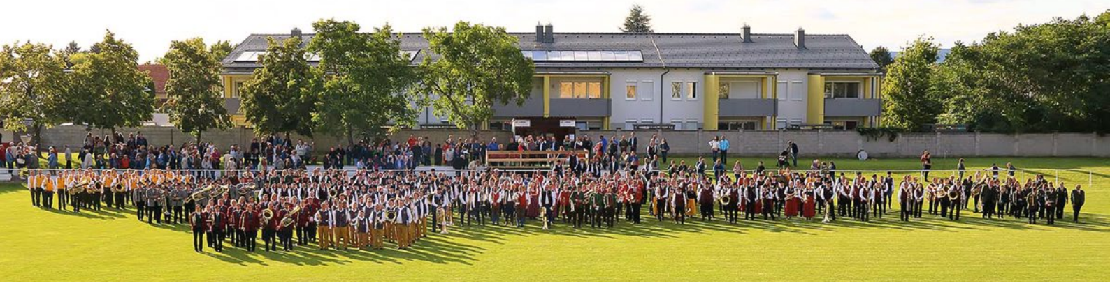
500 Musikanten musizierten nach der Marschwertung gemeinsam am Siegendorfer Sportplatz