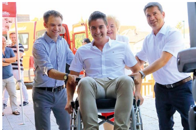
Problemlos ist sogar der Transport von bis zu vier Rollstuhlfahrern möglich

„Dieses ehrenamtliche Service bietet älteren Menschen und Menschen mit besonderen Bedürfnissen die Möglichkeit einer drohenden sozialen Vereinsamung entgegenzuwirken. Dadurch können Fahrten zum Arzt, zu kulturellen Veranstaltungen oder Einkäufe durchgeführt werden“, zeigt sich die ehrenamtliche Präsidentin, LRin Verena Dunst begeistert. Nach erfolgter Registrierung auf der Homepage www.volksengerl.at , bei der die MitarbeiterInnen der Volkshilfe Burgenland unter 02682/61 569 gerne unterstützen, können Fahrten im Kalender eingegeben werden. Sobald ein Ehrenamtlicher diese Fahrt akzeptiert, kann es losgehen.