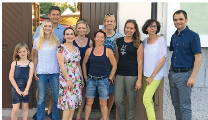
Engagierte Gruppe: Mitglieder des Siegendorfer „Gesundes Dorf“-Teams

Die Siegendorfer sind an ihrer Gesundheit interessiert! Bestes Beispiel dafür ist der unlängst durchgeführte Kräuterworkshop, der wie die vielen Programmpunkte der Initiative „Gesundes Dorf“ auf breiten Anklang traf. Beim Kräuterworkshop stand eine Wanderung zur Loapa am Programm. Wildkräuter wurden angeschaut, gekostet, gesammelt und zur Hirtenhöhle gebracht.