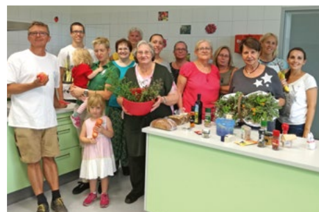
Das „Gesunde Dorf“ macht Schule – oder kocht in der Schule. So wie beim Kräuterkochkurs in der NMS