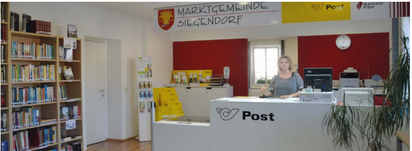
Großzügig: der Postpartner mit der neugestalteten Bücherei wurde vergrößert und modernisiert.

Auch das Bibliotheksangebot wurde im Zuge der Umbauten attraktiviert. Zu den Öffnungszeiten des Postpartners können nun alte Klassiker, aber auch viele Neuerscheinungen ausgeliehen werden.