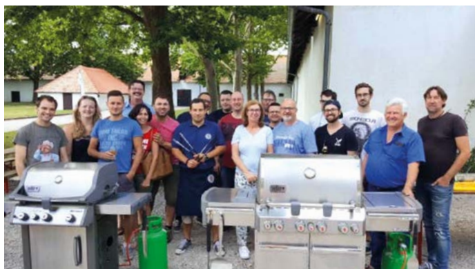
Schnell ausgebucht waren beide Grillkurse dieses Sommers