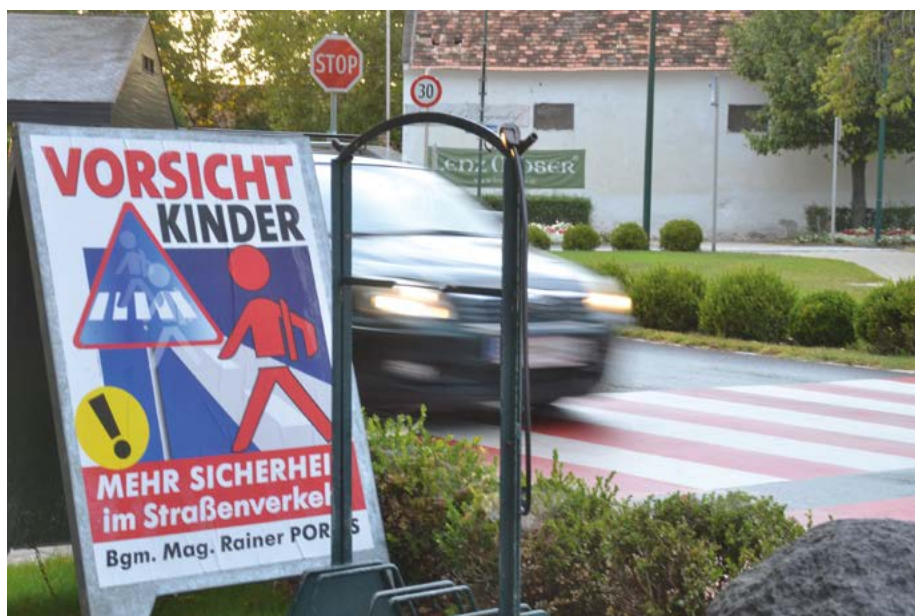
Durch die Einhaltung der 30er-Tempolimits wie hier am Rathausplatz oder im Bereich der Schule können schwere Verkehrsunfälle vermieden werden.