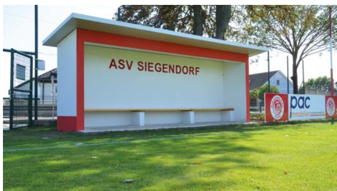
In die Infrastruktur wird investiert – am Sportplatz (Bild) und am Tennisplatz

Bereits vor einiger Zeit setzte sich die Gemeinde das Ziel, mit verschiedenen Initiativen für mehr Gesundheit in Siegendorf zu sorgen und das Bewusstsein der Siegendorferinnen und Siegendorfer im Bezug auf dieses Thema zu fördern.