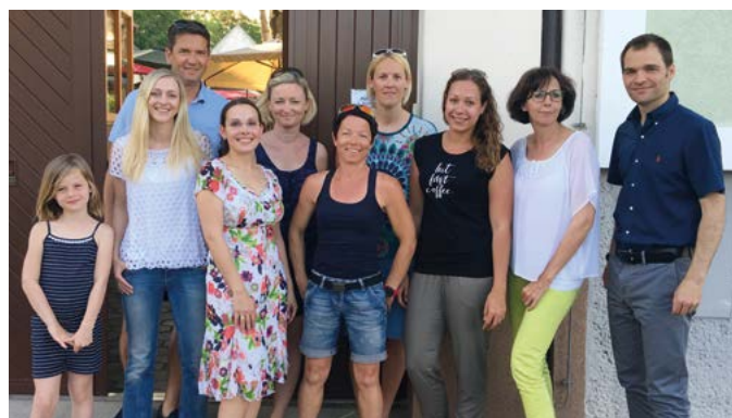
Das „Gesunde Dorf“-Team setzt sich ein und sucht nach Verstärkung

Gegenüber davon befindet sich der bei der Jugend beliebte Skaterpark. Dieser wird noch im Laufe des Septembers um ein Highlight für alle Skater und Rollerfahrer erweitert, wenn in Kürze eine Halfpipe mit einer Länge von acht Metern für Begeisterung sorgen wird.