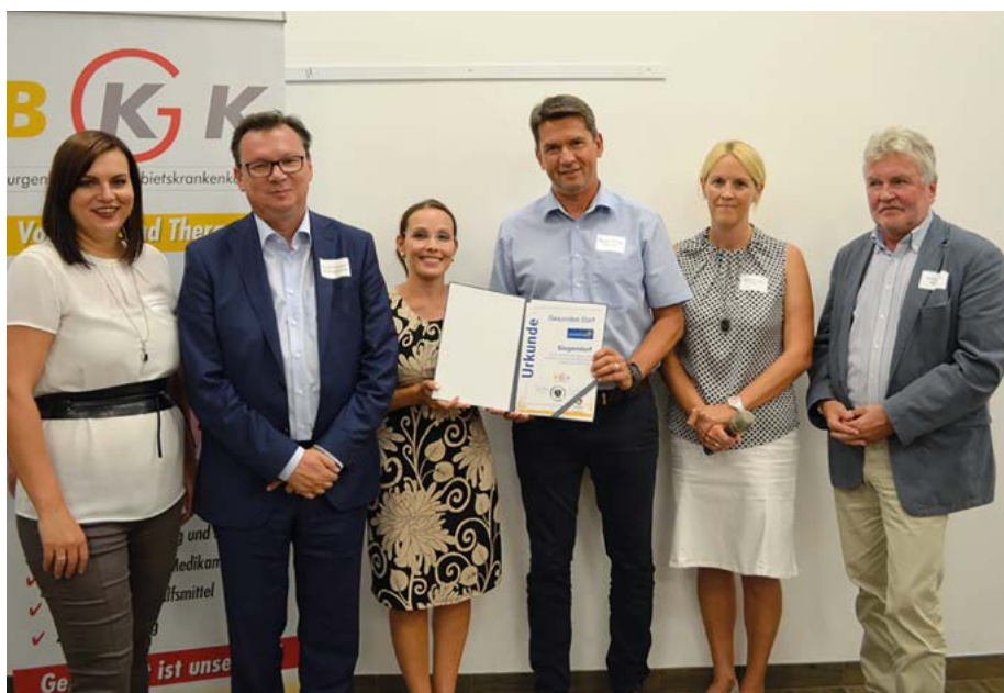
Siegenderdorf wurde als „Gesundes Dorf“ ausgezeichnet

Das Projekt „Gesundes Dorf“ wird im Auftrag der Burgenländischen Gebietskrankenkasse durchgeführt und vom PGA (Verein für prophylaktische Gesundheits-