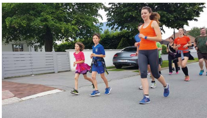
Sportliche treffen sich wöchentlich zum gemeinsamen Laufen