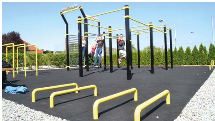
Schweißtreibend: der neue Fitnesspark neben dem Freibad

In der Gemeinde wird ein buntes Angebot für körperliche