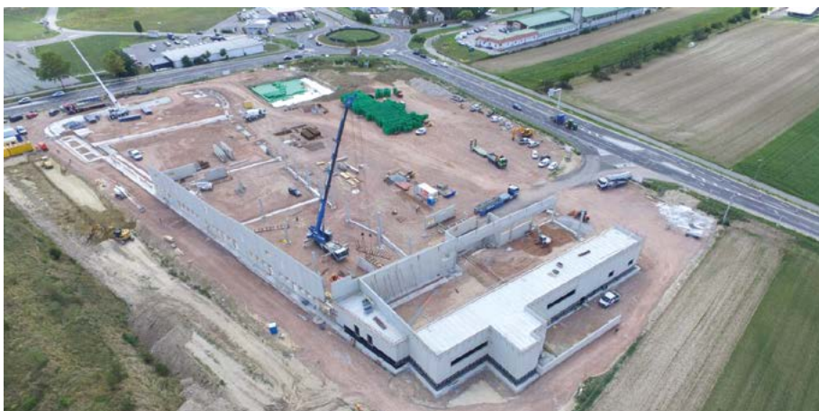
Aktuell ist das Bild neben dem Kreisverkehr noch von Baumaschinen geprägt.